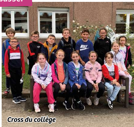
Cross du collège