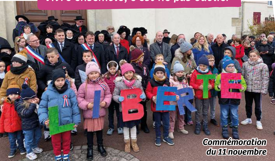
Commémoration du 11 novembre