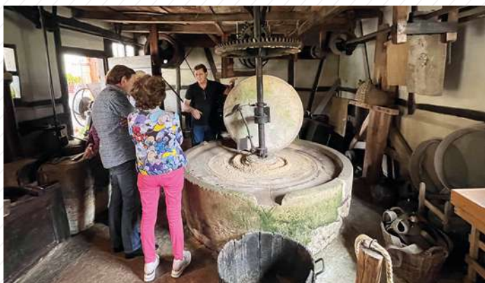
22 septembre : Journée du Patrimoine