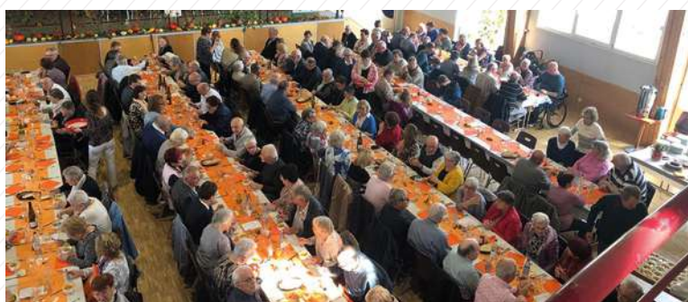
29 septembre : Choucroute de la Paroisse