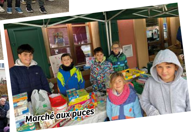
Marché aux puces

Il y a tout cela dans les regards de vos enfants !