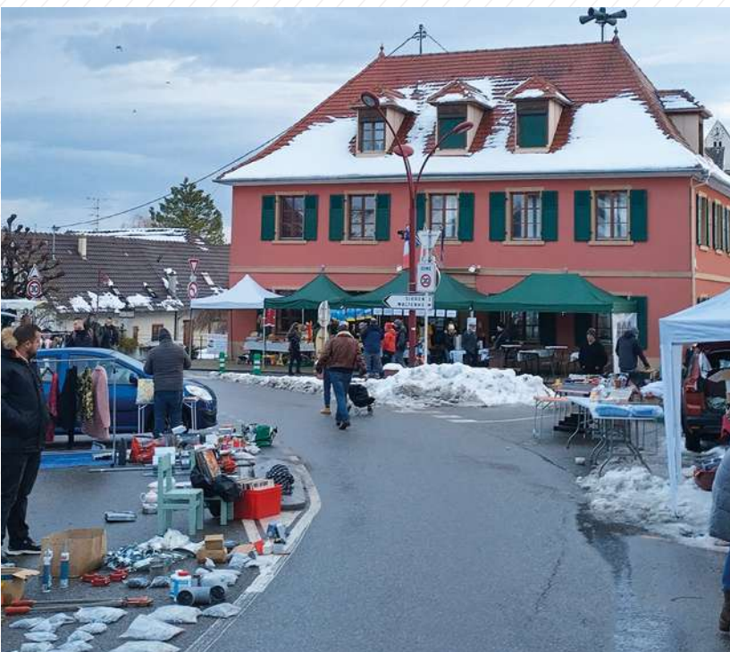
24 novembre : Marché aux puces de l'Amicale des Sapeurs-Pompiers