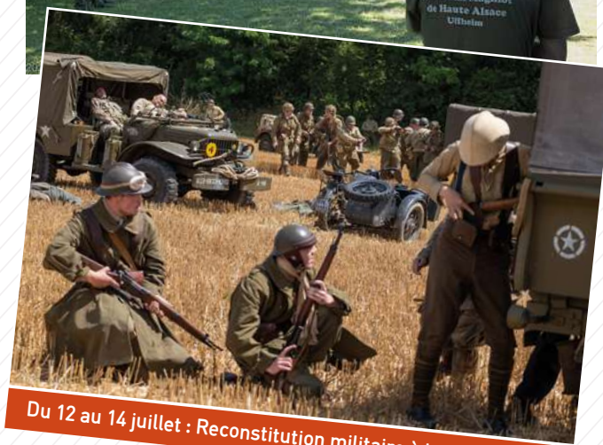
Du 12 au 14 juillet : Reconstitution militaire à la Casemate