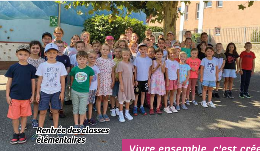
Rentrée des classes élémentaires