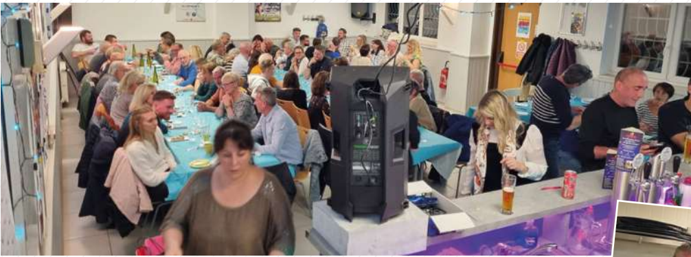
9 novembre : Repas Moules Frites du FCU