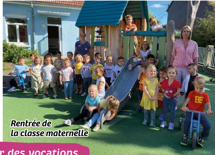
Rentrée de la classe maternelle

Vivre ensemble, c'est créer des vocations