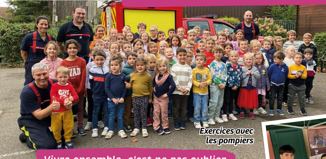
Exercices avec les pompiers

Vivre ensemble, c'est créer des vocations