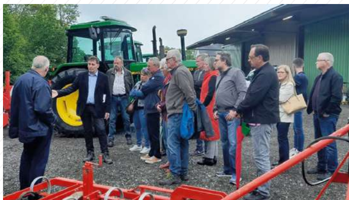
2 juin : Fermes ouvertes