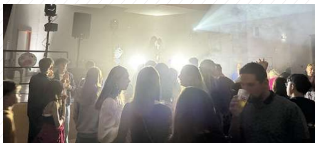
14 septembre : Pump'Uff de l'Amicale des Sapeurs-Pompiers